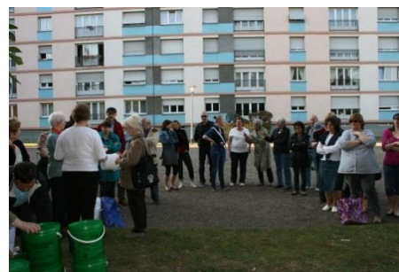
Le compostage collectif

Nous proposons et participons à des présentations publiques de différentes techniques de compostage.