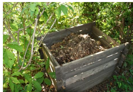
Le compostage individuel au jardin

L'association « la Maison du Compost » a pour objet de promouvoir, de sensibiliser et d'accompagner les citoyens désireux de pratiquer du compostage individuellement ou collectivement.