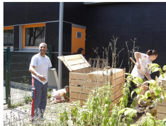
A l'école maternelle de la maille Jacqueline à Strasbourg Hautepierre