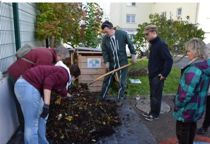
Rue du rivage Ostwald