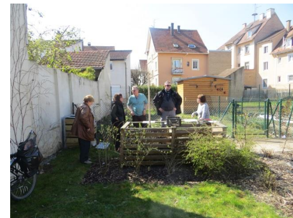
Rue des Vosges à Schiltigheim