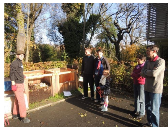
Rue du Moulin à Porcelaine à Strasbourg