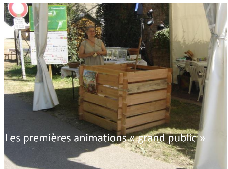
Les premières animations « grand public »

En 2012 les premières actions menées dans le cadre d'une convention avec l'ADEAN, cofinancée par l'ADEME, qui nous permettra par la suite de passer marché avec le SMITOM Haguenau Saverne. Le marché d'une durée initiale de 4 ans a été renouvelé 1 fois. Nous travaillons toujours avec le Smitom et espérons un prochain renouvellement en octobre.