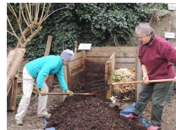
Jardin partagé fridolin à Strasbourg