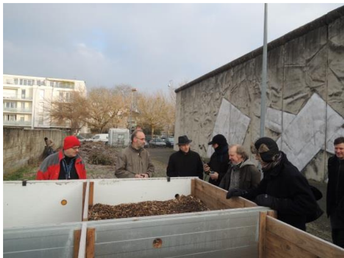
A la maison d'Arrêt de Strasbourg

En 2014, 2015 les premiers sites collectifs installés dans le cadre du « marché » avec la CUS