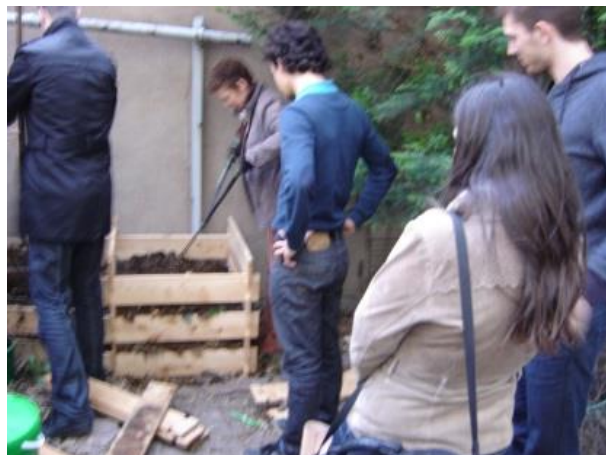
Rue de Dambach à Strasbourg Neudorf