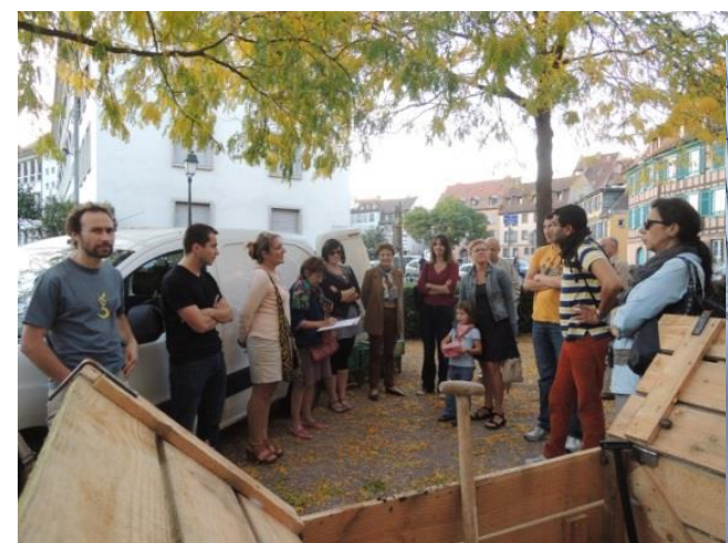
Site public place de la question à Strasbourg