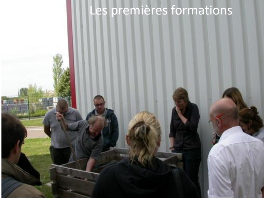
Les premières formations