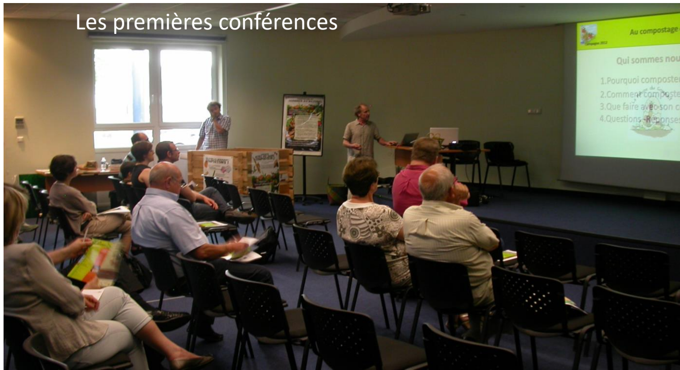
Les premières conférences

En 2012 les premières actions menées dans le cadre d'une convention avec l'ADEAN, cofinancée par l'ADEME, qui nous permettra par la suite de passer marché avec le SMITOM Haguenau Saverne. Le marché d'une durée initiale de 4 ans a été renouvelé 1 fois. Nous travaillons toujours avec le Smitom et espérons un prochain renouvellement en octobre.