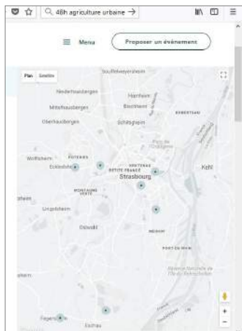
Carte de localisation

entre 9h et 18h suivant les propositions des partenaires